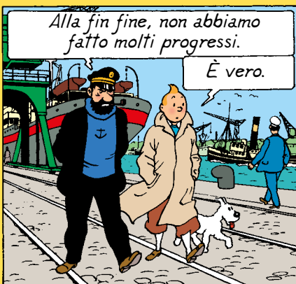
Pont du Pertuis

All'inizio le navi entravano in porto da est (dove oggi sta il sottomarino Espadon ). Poi siccome aumentava il loro tonnellaggio sono dovute entrare da sud, fin dal 1907. Dal 1932 in poi, ad ospitarle fu la Forma Joubert. Infatti da quella sono passate le famose navi Normandie e France . Così come passano tuttora le grandi navi costruite a Saint-Nazaire.