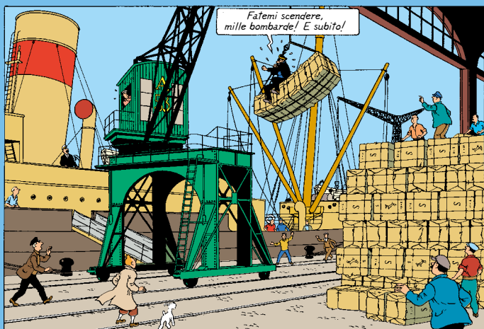
Quai du Commerce