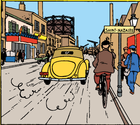
Rue des Chantiers