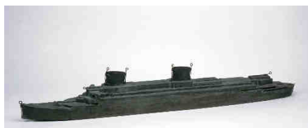
Moule à gâteau en forme de paquebot Liberté (1950)