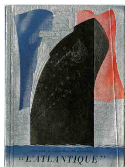
Brochure de présentation, paquebot L'Atlantique (1931), HEMJIC