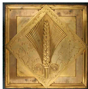
Médaille décorative de la porte de la salle à manger 1 re classe, paquebot Normandie (1935), Adalbert Szabo, dépôt du Musée des Arts Décoratifs de Paris.