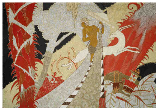
Étude pour une œuvre décorative en laque, appartement de grand luxe, paquebot L'Atlantique (1931), Gaston Priou