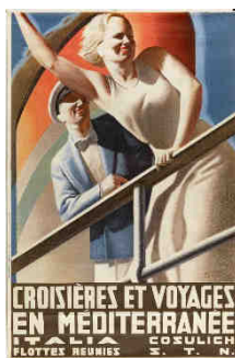
Affiche publicitaire des Flottes Réunies Italiennes pour des croisières en Méditerranée, datée entre 1934 et 1939, Gino Boccasile

L'équipe de l'Écomusée réalise le long travail de constats d'état, de préconisations pour la présentation et le transport, de préparation des œuvres et des conventions de prêt. Les objets doivent être assurés par l'emprunteur.