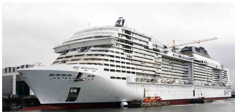
Un nouveau géant : le MSC Meraviglia dans le bassin d'armement du chantier naval / B. Biger, STX France.

Fin mai / début juin 2017 sera livré le nouveau géant des mers actuellement en construction au chantier naval STX de Saint-Nazaire, le MSC Meraviglia , un des plus grands paquebots de croisière du monde (331 mètres, 6 000 passagers). www.saint-nazaire-tourisme.com