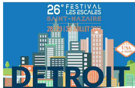
Les Escales : cap sur Detroit.

Farniente Festival : deux jours de musiques « libres et sentimentales », dans le cadre exceptionnel de la plage de Monsieur Hulot à Saint-Nazaire. Rendez-vous les 21 et 22 juillet 2017. http://farniente-festival.org/