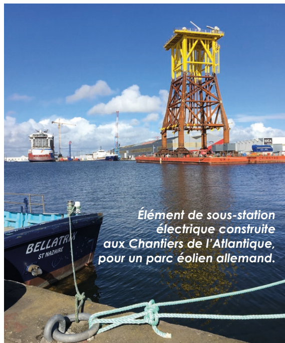
Élément de sous-station électrique construite aux Chantiers de l'Atlantique, pour un parc éolien allemand.

Dans ce contexte d'une filière exceptionnelle et porteuse d'avenir, la CARENE, Agglomération de Saint-Nazaire, a souhaité créer un centre de découverte sur l'éolien en mer en s'inspirant d'initiatives dans des pays ayant déjà ouvert des champs éoliens en mer. En Grande-Bretagne, Allemagne, Suède ou encore au Danemark, tout projet d'éolien en mer est accompagné d'un centre pédagogique ou d'une exposition, pour permettre aux habitants et touristes de s'emparer des projets et de leurs enjeux.